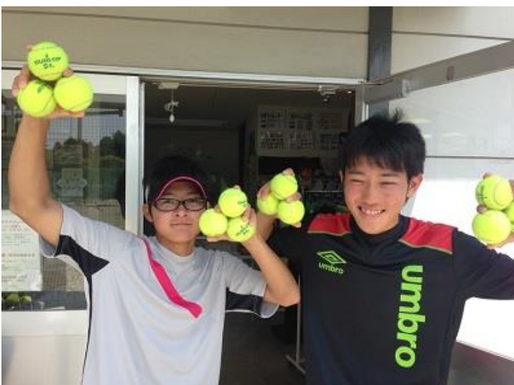
コンソレーション優勝：大森・高見組